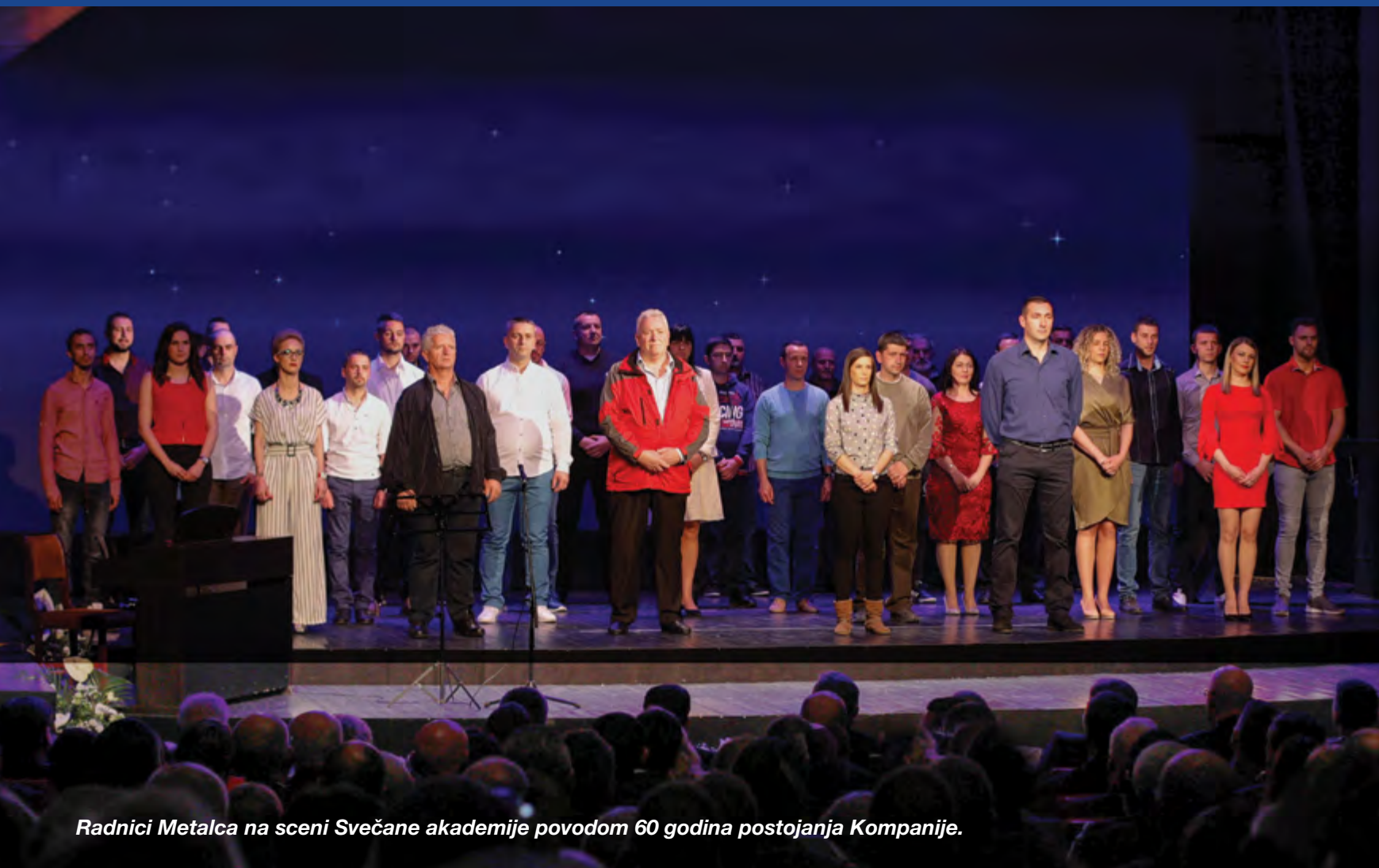
Radnici Metalca na sceni Svečane akademije povodom 60 godina postojanja Kompanije.

Metalčevi radnici spadaju u veoma cenjene – stručno i moralno. Kao Kompanija, koja je godinama razvijala posebnu korporativnu kulturu i ulagala u lojalnost svojih zaposlenih, koja je i najteže krize prebrodila ne otpuštajući nijednog radnika - Metalac preuzima mere da svoj najvredniji kapital odbrani od preuzimanja, svestan da je mnogim firmama, posebno stranim, najjeftinije da preuzmu »gotovog« čoveka. A za najbolje radnike se vredi boriti. Ako ne može uvek zaradom, znamo u čemu smo i dalje jači.